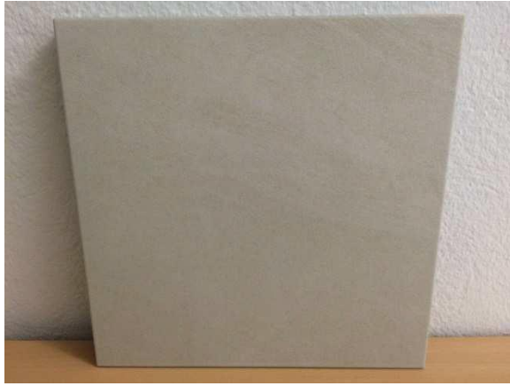
Abita Ego Biscuit (hellbeige)