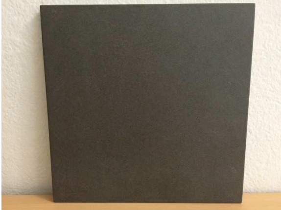
Abita Ego Coal (dunkelgrau)