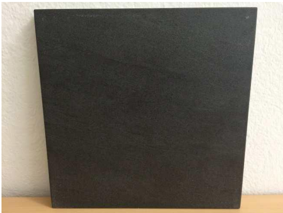
Abita Ego Slate (anthrazit)