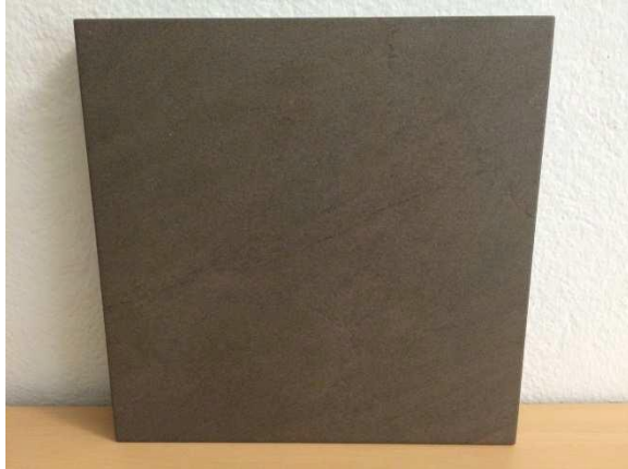
Abita Ego Earth (braun)