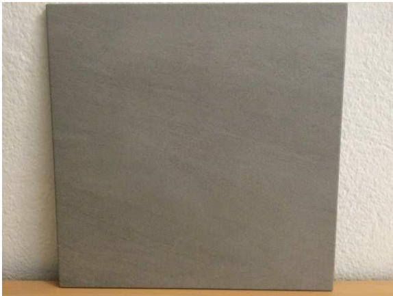
Abita Ego Ice (hellgrau)