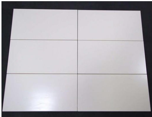
Villeroy & Boch, Serie White & Cream