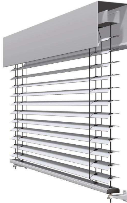
Beispielfoto elektrische Raffstores

Vom Einreichplan abweichende Ausführung möglich, zusätzliche Raffstores gegen Aufpreis