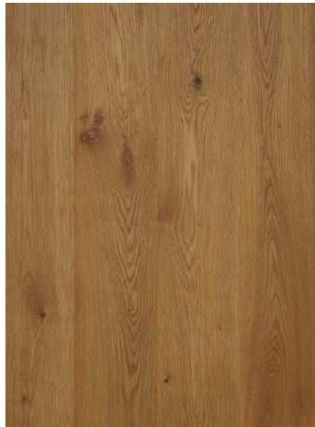
Eiche astig (Beispielfoto)